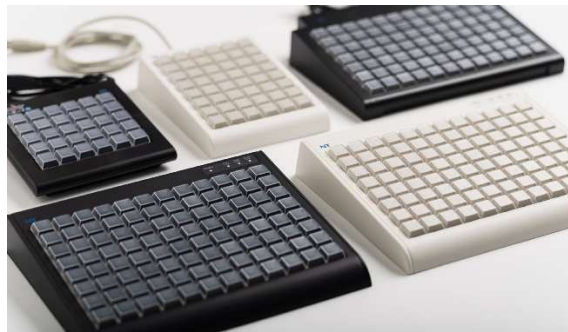
30 キー / 48 キー / 84 キー / 96 キー