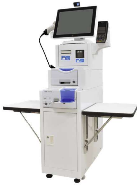
セルフレジ POS NT-POS120W フロア式