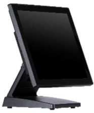
15" スタンダード/ファンレス NT-POS120