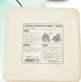
チェアセンサーパッド (CS-001)